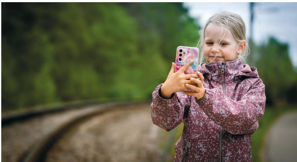
Raudtee ei ole pildistamise koht – pilti võib teha ainult ohutust kaugusest

Seepärast tasub meeles pidada lihtsat reeglit: raudteed ületatakse ainult selleks ette nähtud kohas ning raudtee ei ole jalutamise, mängimise, poseerimise ega pildistamise paik. Kui soovid raudteed fotole, tee pilt ohutust kaugusest ja nii, et keegi ei viibi rööbastel ega raudtee ohtlikus läheduses.