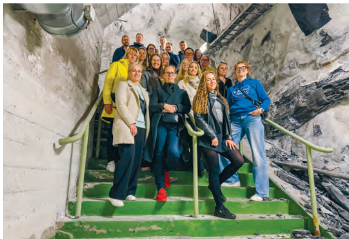
Õppereisil tutvuti Oslo maa-aluste varjumiskohadega

Saime palju häid mõtteid ja praktilisi kogemusi, kuidas kriisideks paremini valmis olla ning keerulistes olukordades inimesi toetada ja selgelt teavitada.