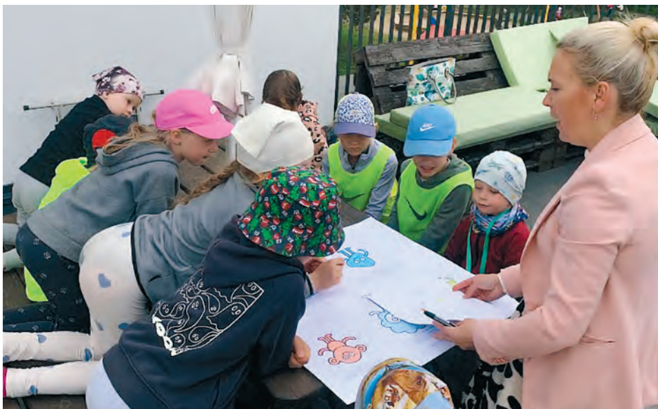
Laste nõukogu parimate nimede üle aru pidamas

Koos tunnusraafikaga ja uue identiteediga sündis ja rullus meie ees lahti ka Terakese lugu.