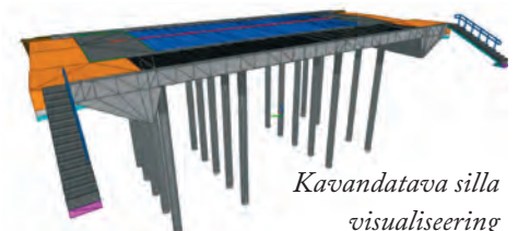
Kavandatava silla visualiseering