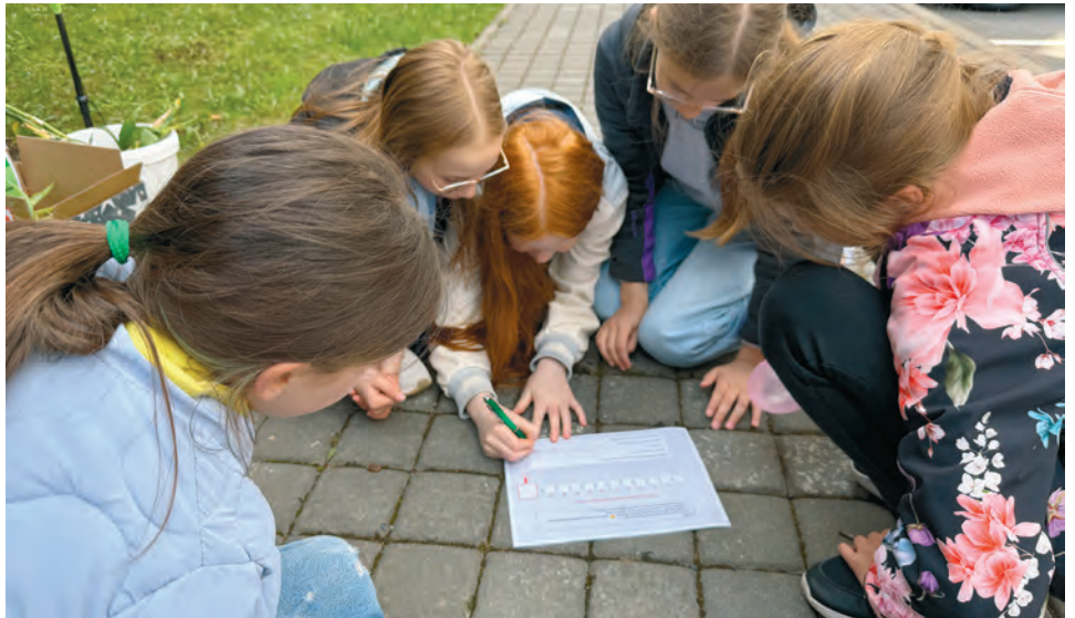
Kõige menukamaks sündmuseks kujunes seiklusorienteerumine