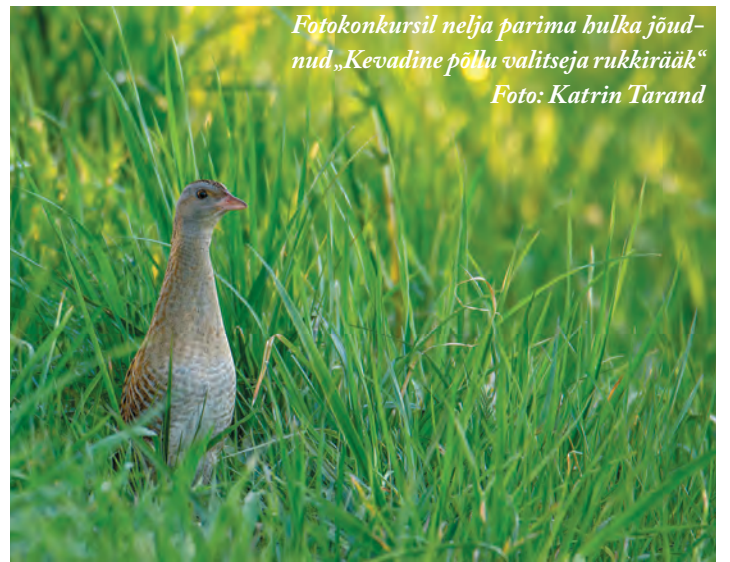
Fotokonkurssil nelja parima hulka jõudnud „Kevadine põllu valitseja ruckirääk“