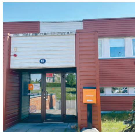
Postkast aadressile Teaduse 13 jääb esialgu alles

Samuti pakub Omniva personaalset postiteenust – võimalust kutsuda postikuller enda koju või tööle. Teenus on loodud inimeste jaoks, kes ei saa või ei soovi digilahendusi kasutada, samuti on see hea lahendus liikumisraskustega