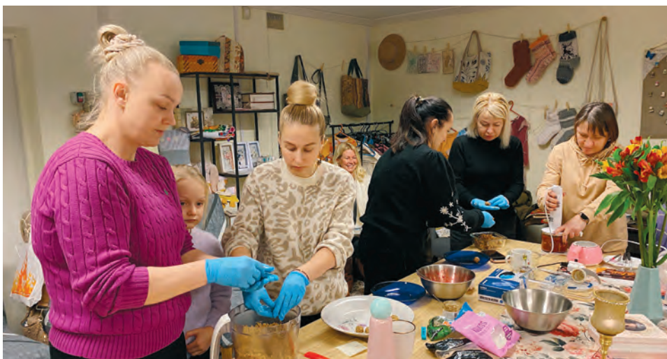
Tervislikke maiustusi valmistamas

Oleme kohtunud Saku Naiskodukaitse ägedate naistega ja Saku priitahtlike pritsimeestega ning rääkinud kogukonna turvalisusest ja kriisideks valmisolekust.