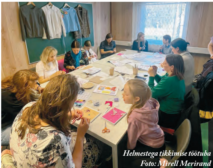
Helmestega tikkimise töötuba

Kohtume juba järgmisel aastal uutel ja põnevatel keskkonnakuu üritustel!