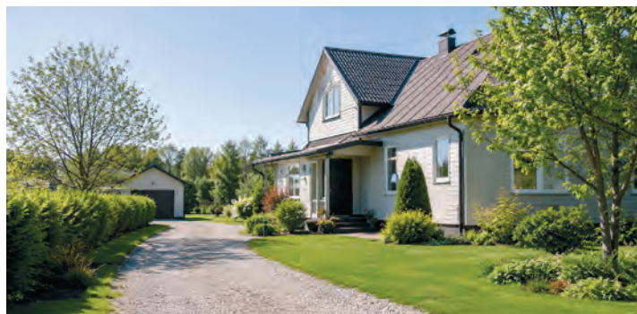
Toetus aitab parandada kodude vee-, kanalisatsiooni- ja juurdepääsutingimusi

Toetuse maksimaalne suurus on kuni 3000 eurot ning see võib katta kuni 50% tegevuse kogumaksumusest.