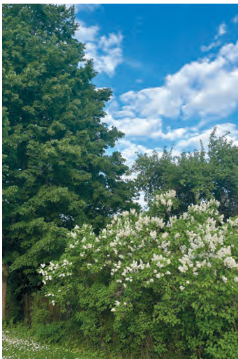
Puud ja roheline annavad varju ja leevendavad kuumalainete mõju.

võivad tõusta ootamatult ja olla senisest tugevamad. Valmis tuleb olla nii vahe-tuteks tormikahjudeks kui ka elektriliinidele langenud puude põhjustatud elektrikatkkestusteks.