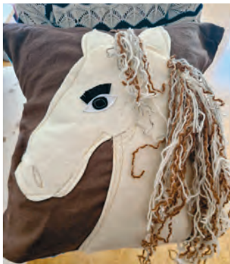
Isetehtud padi on rohkem kui lihtsalt mõnus peaalune

Vanad riided, kangajäädid, naharibad, klaas- või plekkpurgid saavad ringis uue elu. Lapsed õpivad kasutama õmblusmasinat, tutvuvad õmblustehnikatega ning valmistavad päris oma kätega kotte, padjakatteid, kuumaaluseid, käevõrusid ja palju muud. Need ei ole lihtsalt esemed, vaid väikesed saavutused, mille üle uhkust tunda ja mis panevad laste silmad särama.