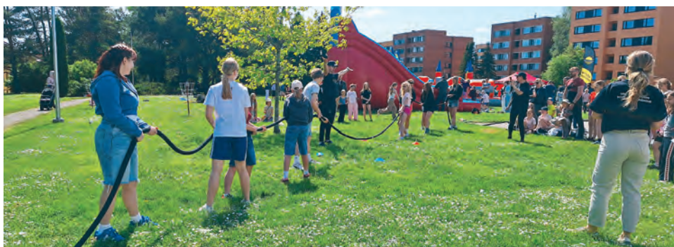
Noortekeskuse korraldatud lastekaitsepäev

Kohtume suvel malevas, laagrites ja sügisel juba uues noortekeskuses!