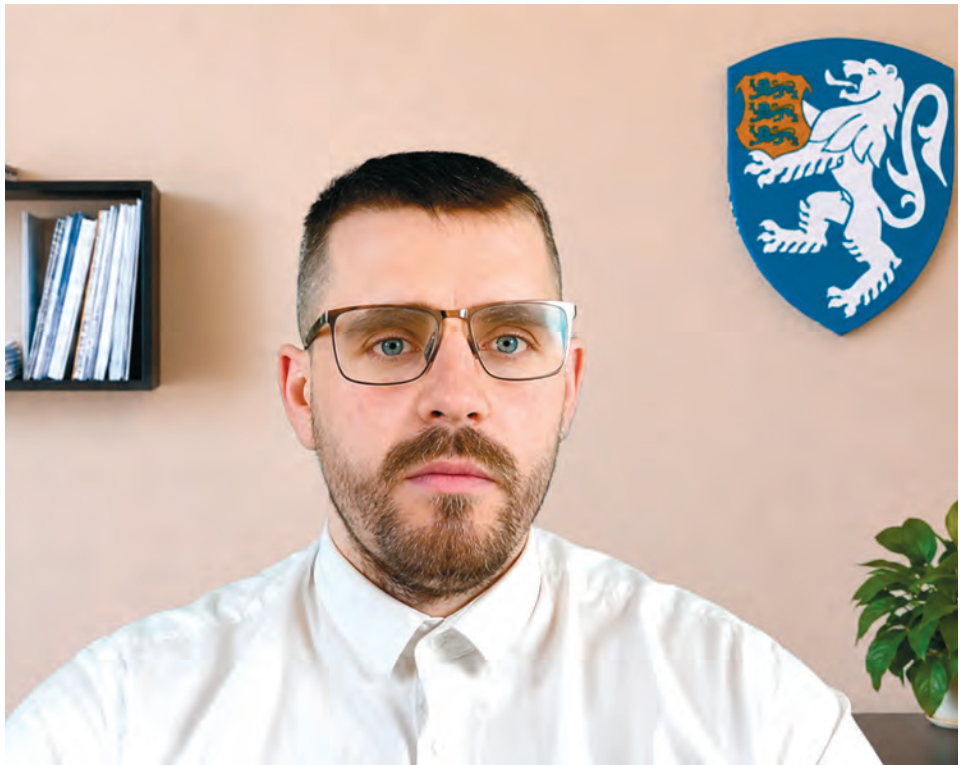
Kuvatõmmis Whatsappi helistanud kelmist