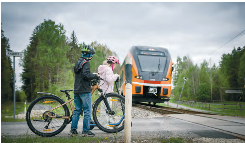
Raudteed ületades tuleb peatuda ja veenduda, et tee on vaba

Oluline ei ole ainult reeglite teadmine, vaid nende kujundamine harjumuseks. Väga palju aitab see, kui vanem liigub koos lapsega tema tavapärasel trajektoorigil ning vaatab koos üle kohad, kus tähelepanu võib hajuda või kus võivad tekkida ohtlikud olukorrad.