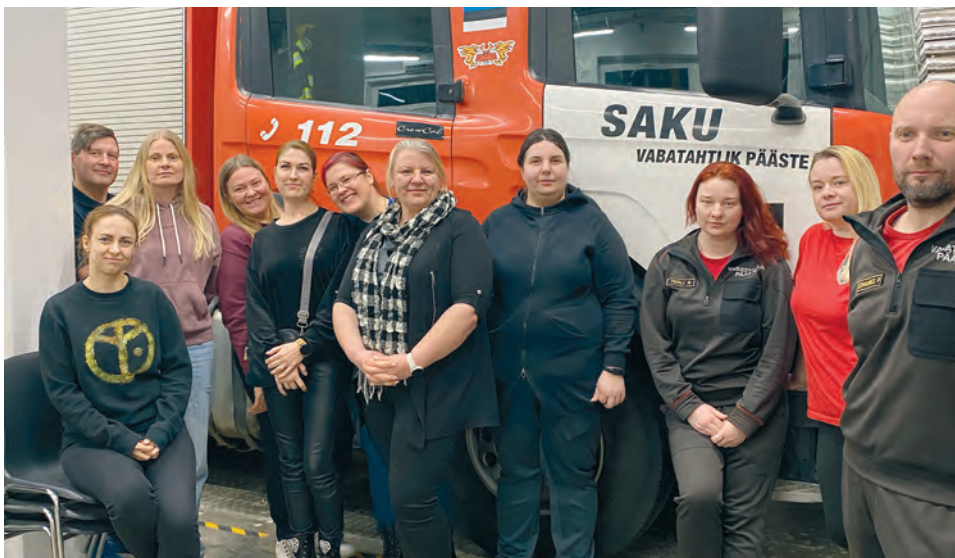
Kohtumine vabatahtlike päästjatega