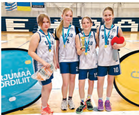
Saku Gümnaasiumi võidukad tüdrukud