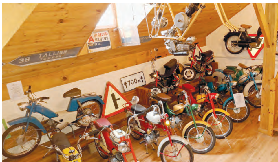
Moppeedid on mürdosa mootorrattamuuseumi väljapanekust