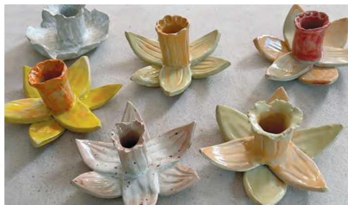
Väikeste keraamikute näitus Kiisa raamatukogus ja näited Sakus valminud töödest