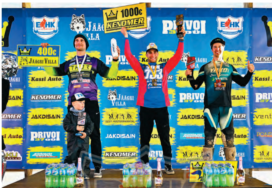
Eesti Liivakuninga esikolmik