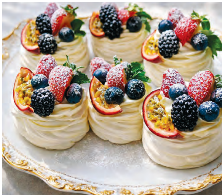
Klientide lemmikud – Pavlova koogid