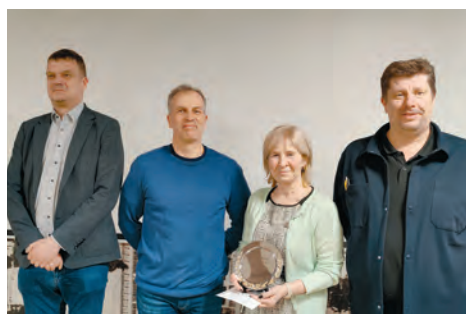
Võistkond Paprika

Küsimused valmistasid sel hooajal ette Alar Viivik ja Tenno Sivadi, kelle koostatud ülesanded panid osalejate teadmised korralikult proovile. Läbi hooaja osutus kõige edukamaks võistkond Paprika, kes kogus kokku 79 punkti ning tuli sarja üldvõitjaks.