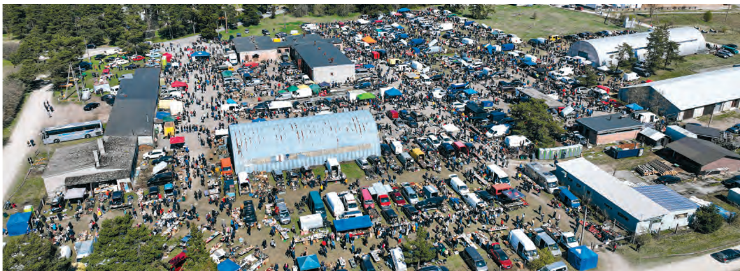
Tagadi Restaatorite päev toimub tänävu 3. mail