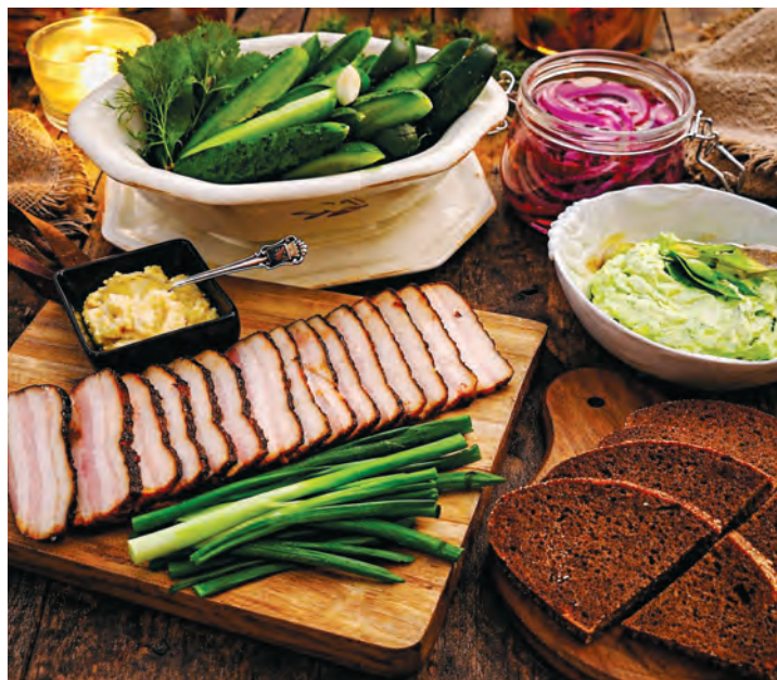
Lihtsad ja isuäratavad kodused maitseed

Aprilli tee 1, Kasemetsa FB: Purje tee koduköök