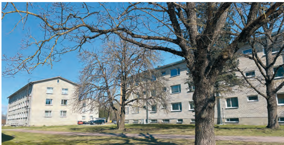
Kinnisvarahaldur tegeleb nii hoone tehnilise seisukorra, elanike ootuste kui ka koostööpartnerite ja otsustajatega

Oluline osa haldustööst on ennetustegevus. Rikked ei teki enamasti ootamatult, vaid annavad endast märku väikeste