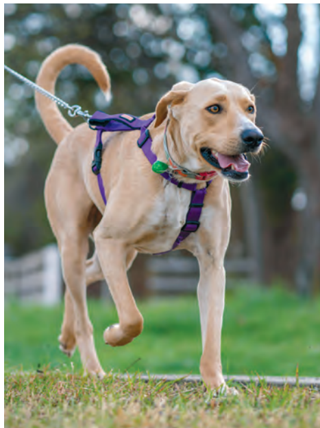
Lemmiklooma heaolu eest vastutab omanik

JOEL VILLEM | haljastuse ja heakorra peaspetsialist