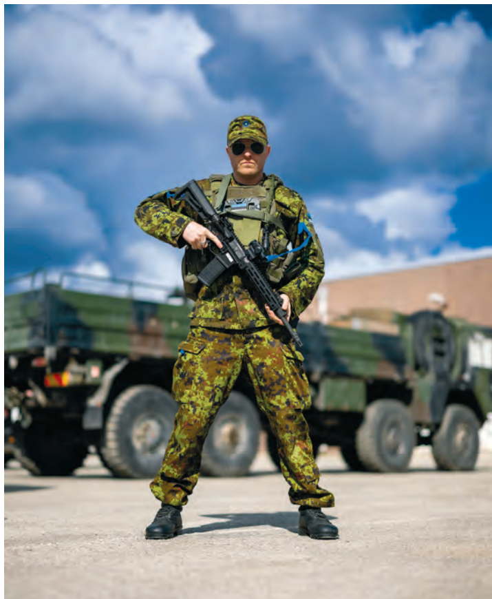
Erlend panustab ka riigikaitse